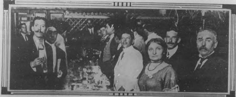
Vista del banquete celebrado por los mexicanos amigos y admiradores de los diestros Gaona y Belmonte, que han sido nuestros huéspedes a su paso para la capital Azteca.

La Revista "Azul". —Con gusto publicamos las fotografías neméritos y queridos compañeros que allí laboran.