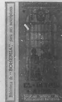
Los regalos de "Bohemia".—Grabado que representa la cubierta de la preciosa novela "El Último Amor" que regalamos este mes á nuestros abonados.