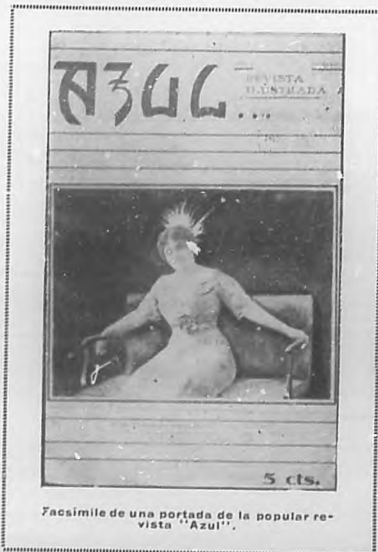
Facsimile de una portada de la popular revista "Azul".