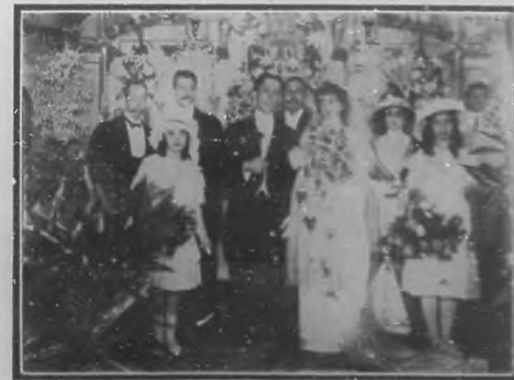
La boda Carvajal-Bello.—Aspecto del altar mayor de la Iglesia de Marianao; en el que aparecen los desposados en unión de los padrinos y testigos cuyos nombres damos en nota aparte.

Damos las gracias á tan apreciable caballero y le deseamos muchos éxitos.