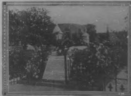
Tumba del patriota Estrada Palma en Oriente, visitada con motivo del quinto aniversario de su fallecimiento.

Felicitemos á la selecta publicación y á sus numerosos abonados porque saborearán las exquisiteces de la labor que habrá de realizar el querido compañero, cuyo brillante estilo es siempre regocijo de sus lectores.