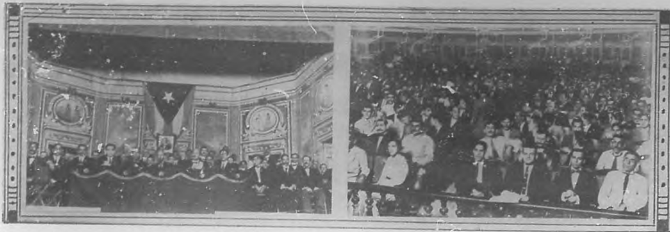
En memoria de Estrada Palma. Dos aspectos de la Velada que en honor de este gran patriota tuvo efecto el pasado día 3 en el teatro "Polyteama".

En memoria de Estrada Palma. —En el "Polyteama" se efectuó con público numeroso la velada fúnebre en homenaje al insigne patriota Estrada Palma, fallecido hace cinco años en la Provincia Oriental.