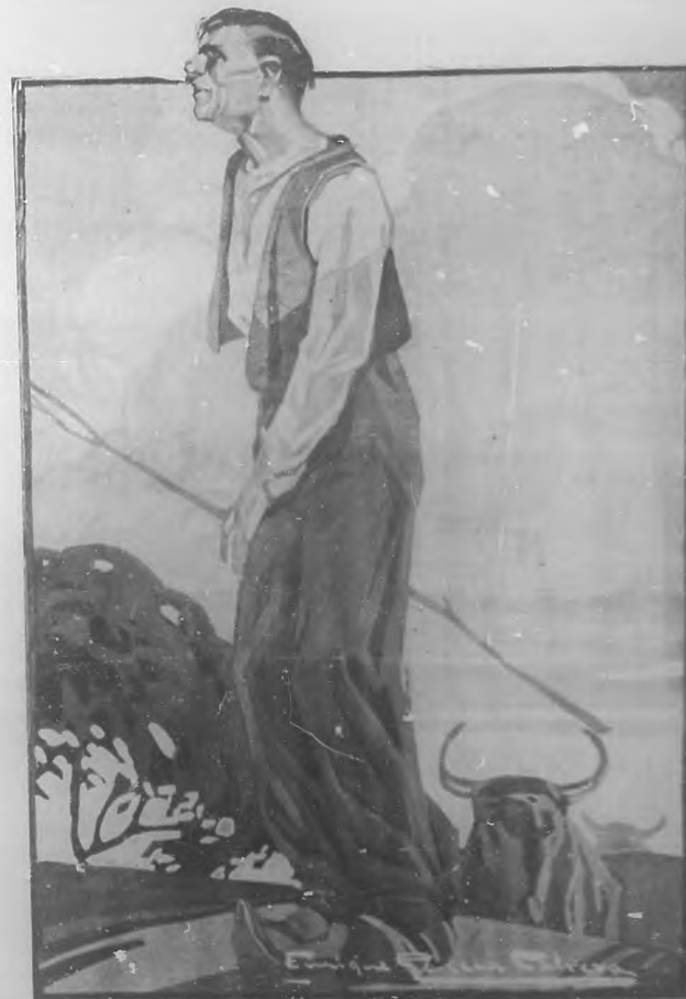
Dibujo de Garcia Cabrera.